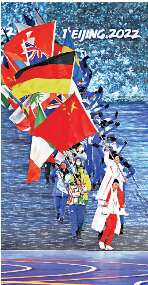
▲北京冬奧圓滿閉幕。圖為當日代表團旗幟和運動員入場。