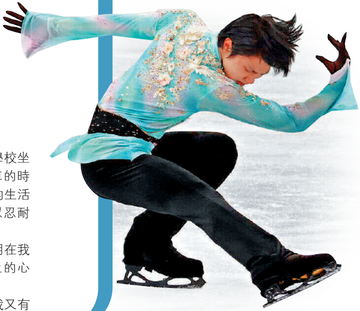
▲羽生結弦挑戰阿克塞爾四周半跳，距離成功就只差一點點。